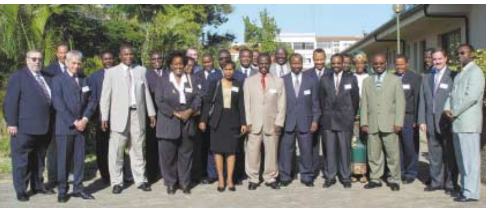
Gestores de topo de empresas de telecomunicações de África e Europa estiveram reunidos em Maputo, sob a égide da União Internacional de Telecomunicações (ITU).

No encontro, no qual participaram representantes de alto nível de empresas, bem como de organismos reguladores, entre os quais gestores de topo da área de telecomunicações de 12 países de África e Europa, foram apresentados diversos temas condizentes com a concorrência e competitividade na área das telecomunicações.